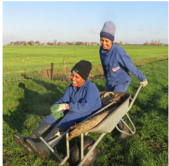
Foto: Deze twee vrouwen verbleven in 2020 op een gastadres. Ze hebben nu een verblijfsvergunning.

In het jaarverslag in de bijlage een uitgebreid verslag van ons werk in 2020. Hier een samenvatting.