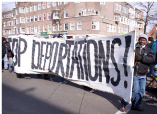
Foto: Cliënten van STIL demonstreren tegen uitzettingen.

Veel mensen die bij STIL komen, hebben geen asiel gekregen maar vrezen voor terugkeer. Soms bevestigen internationale organisaties hun angst, maar hebben ze toch geen juridisch perspectief in Nederland als het gaat om verblijfsrecht. Daarbij is het vaak zo dat de beoordeling van hun asielverzoek in onze ogen niet zorgvuldig genoeg gebeurd is. Vaak wordt een onevenredige bewijslast op de schouders van de vluchtelingen gelegd, met andere woorden: ze kunnen onmogelijk bewijzen dat ze wel degelijk te vrezzen hebben voor vervolging bij terugkeer. Er is veel kritiek op het gebrek aan onafhankelijke deskundigen bij de asielbeoordeling door de Immigratie- en Naturalisatiedienst (IND).