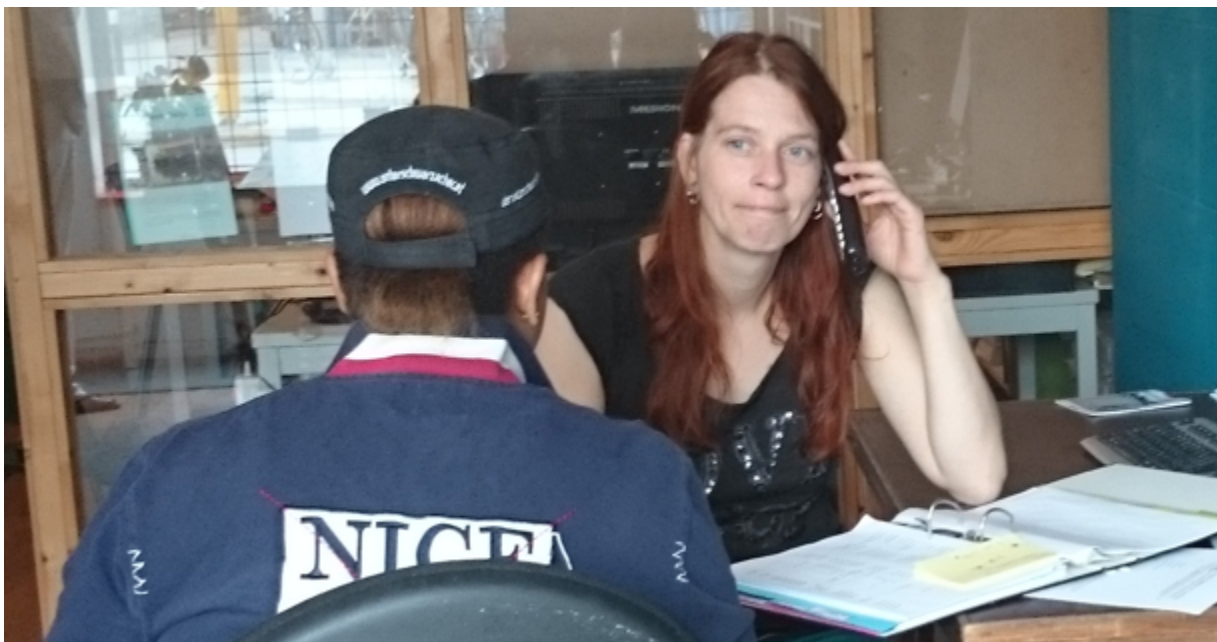
Vrijwilligster op het medisch spreekuur van STIL maakt afspraak met een huisarts voor een Congolese vrouw.

Enkele weken later vertelde ze dat ze graag terug wilde naar haar land van herkomst maar niet wist hoe. STIL regelde een afspraak bij een instantie die steun geeft bij terugkeer. Via die organisatie kon ze ook Noodopvang krijgen, een kamer gefinancierd door de gemeente Utrecht. Intussen had ze tientallen medische afspraken in het ziekenhuis. Ze wil een eigen winkel beginnen in haar land. Maar maakt zich zorgen of ze haar medicatie dan wel kan betalen omdat die erg duur is.