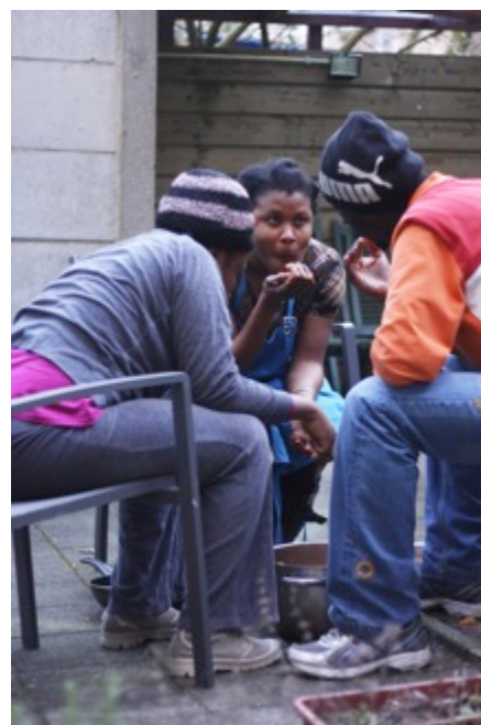
Foto onder: Nederlandse les in het Ubuntuhuis. Foto van Carlijne Pieters.

Foto rechts: Koken in de tuin van het Ubuntuhuis. Foto van Carlijne Pieters.