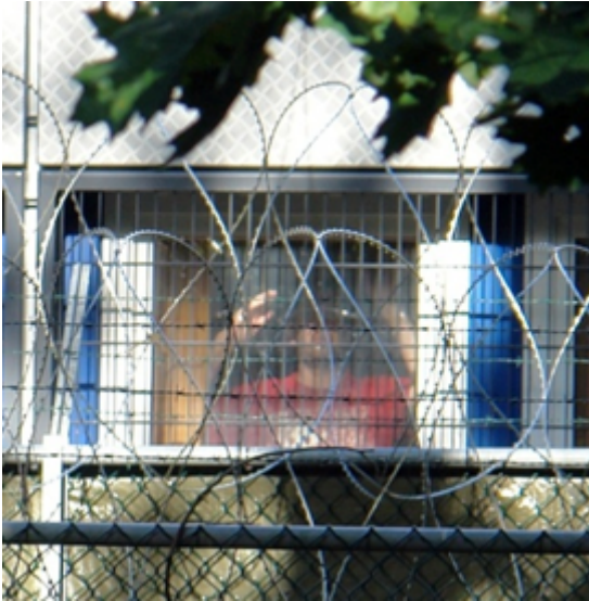
Foto: iemand zonder verblijfsvergunning, voor onbepaalde tijd in vreemdelingenbewaring in Kamp Zeist, ofwel Detentiecentrum Soesterberg.

hebben weinig tot geen juridisch perspectief. Ook zijn ze op straat beland zonder mogelijkheid in eigen levensonderhoud te kunnen voorzien. Ze zitten vaak klem: enerzijds mogen ze hier niet blijven, anderzijds kunnen ze niet terugkeren.