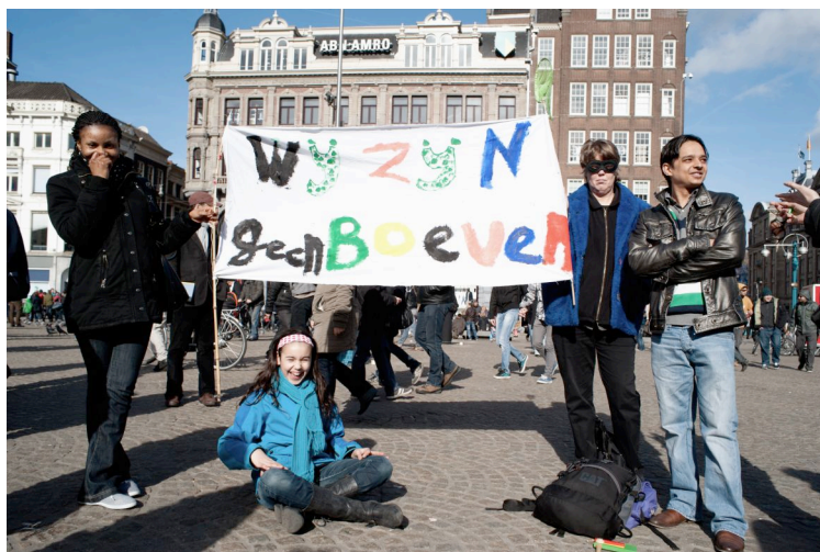
Clënten en bekenden van STIL protesteren in Amsterdam tegen de strafbaarstelling van onschuldigen

Vaak hebben onze cliënten te maken (gehad) met meerdere keren opsluiting in vreemdelingendetentie. Hier zitten mensen onschuldig, voor onbepaalde tijd. Deze gevangenschappen zijn zogenaamd bedoeld om hen het land uit te zetten maar ongeveer de helft van de mensen belandt na maandenlange opsluiting weer op straat. De opsluiting kan meer dan een jaar duren, onder slechte omstandigheden, en maakt mensen letterlijk kapot. Niet voor niets citeren we onze vrijwilliger Leo in hoofdstuk 3, die constateert dat het beleid bedoeld is om Nederland zo onaantrekkelijk mogelijk te maken zodat mensen bij voorbaat al niet zullen komen. Want het verwijderen van mensen als ze eenmaal hier zijn, lukt niet zo.