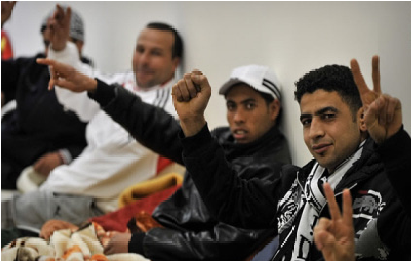
Migranten in hongerstaking, februari 2011 in Griekenland

Migratie heeft alles te maken met mondiale onrechtvaardigheid. Zolang er economische ongelijkheid en oorlog heerst in de wereld, zullen mensen veelvuldig blijven migreren naar plekken waar ze veilig zijn en waar ze zichzelf kunnen onderhouden. Kunnen wij het hen kwalijk nemen? Onze regeringen zijn vaak medeverantwoordelijk door de steun aan bepaalde oorlogen, dictators, een economisch systeem dat ongelijkheid tussen gebieden in de wereld in stand houdt of verergert, door de IMF en de Wereldbank wanbeleid uit te laten voeren met economische en ecologische rampen in ontwikkelingslanden ten gevolge. Personen, goederen en geld uit rijke Westerse landen stromen de hele wereld over. Zou het niet eerlijker zijn als mensen uit ontwikkelingslanden net zo vrij kunnen reizen als westerlingen? En net zo vrij als de Europese vrachtwagens waarin migranten zich vaak verstoppen? Nu gebeurt vooral het tegenovergestelde: grondstoffen en hoogopgeleiden worden uit ontwikkelingslanden weggehaald en lage loonarbeid er juist naartoe verplaatst. Dit terwijl Europese grenzen angstvallig worden dichtgehouden voor personen uit ontwikkelingslanden.